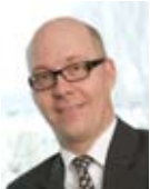
Antoisia lukuhetkiä toivoen,

Toivomme että viihdyt lehtemme parissa. Otamme vastaan palautetta ja juttuideoita osoitteeseen: tools.fi@fi.atlascopco.com