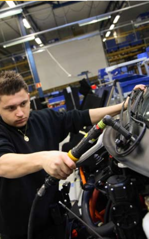
Meneillään tuulilasinyyhkijöiden asennus.