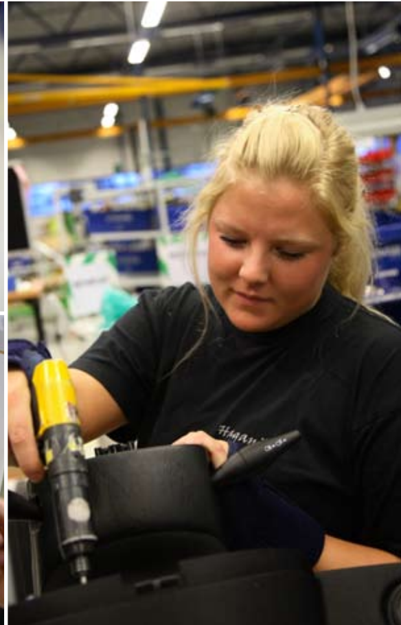
Suurella osalla asentajista on kokemusta Volvolta ja Saabilta.