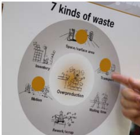
YLLÄ: Tensor DS7 -ohjausrasia, joka ohjelmoidaan PC:stä halutuille momenttitasoille. ALLA: Thinkin tuotantomallia sovelletaan koko ketjuun.